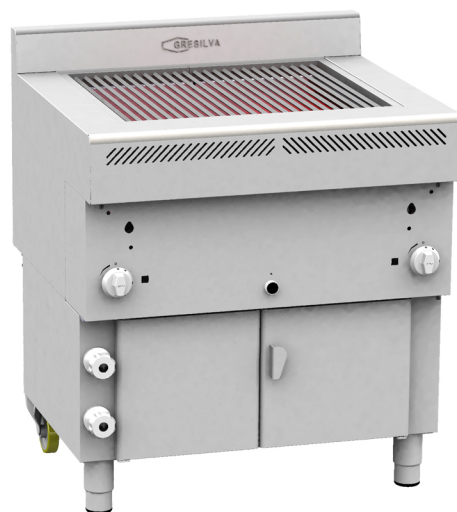
Parrillas con entrada y salida de agua